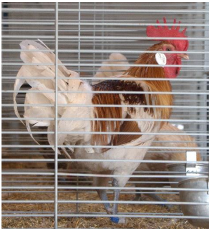
Haan in de kooi

https://drentsehoenclub.nl/fokkersdag-2024