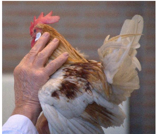
Diep in de ogen kijken